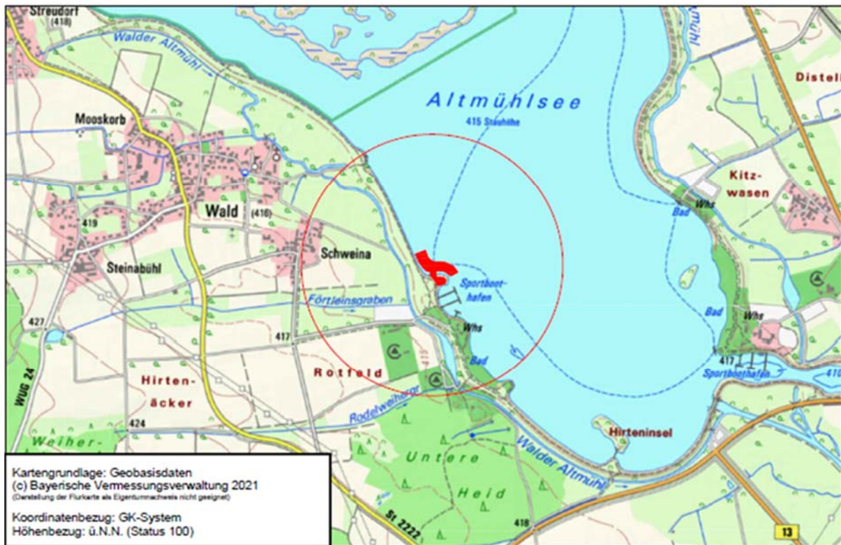
Übersichtslageplan zum Ort des Bebauungsplans „Schwimmende Ferienhäuser auf dem Altmühlsee“

Der Geltungsbereich umfasst eine Teilfläche des Grundstücks mit der Flurnummer 193 der Gemarkung Wald zum Zeitpunkt der Aufstellung des Bebauungsplans