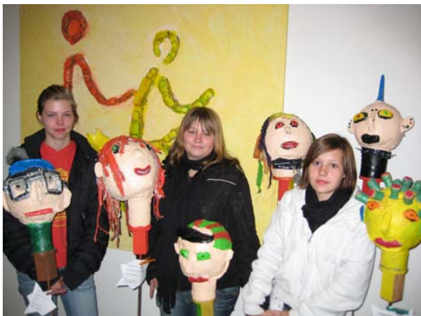
Schülerinnen des Sonderpädagogischen Förderzentrums Roth vor ihren Werken