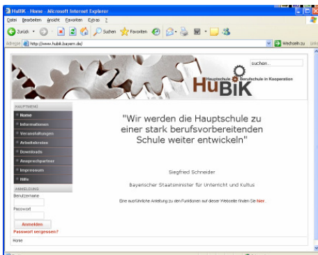
Grafik: Roland Karl, Städt. BS 6, Nürnberg, 10. Klasse, Mediengestalter

Alle Mitglieder der Arbeitskreise können mit Hilfe einer Up- und Downloadfunktion Dateien in den Downloadbereich laden und diese dann anderen Arbeitskreisen zur Verfügung stellen. Darüber hinaus ist es möglich, Fragen und Informationen in ein gemeinsam genutztes Forum einzustellen, Artikel auf der Seite zu veröffentlichen und interessante Webseiten einer Linksammlung hinzuzufügen.