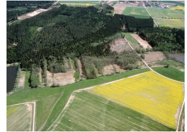
Schrägluftaufnahme der Moosteile am Klarweiher aus südwestlicher Richtung

Das NSG "Moosteile am Klarweiher" besteht aus einem weiteren vermoorten Abschnitt des Moosgraben-Talraumes und der Verlandungszone des Klarweihers. Die Vegetation setzt sich aus Röhrichten, Großseggenrieden, Nasswiesen, Hochstaudenfluren, Feucht- und Erlenbruchwäldern und der Schwimmblattvegetation des Weihers zusammen.