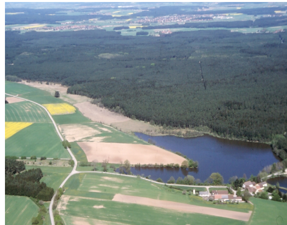
Schrägluftaufnahme des Hammerschmiedsweihers aus südlicher Richtung

Die Übergangs- und Schwingrasenmoore sind mit ihren seltenen Pflanzenarten mittelfrankenweit einmalig.