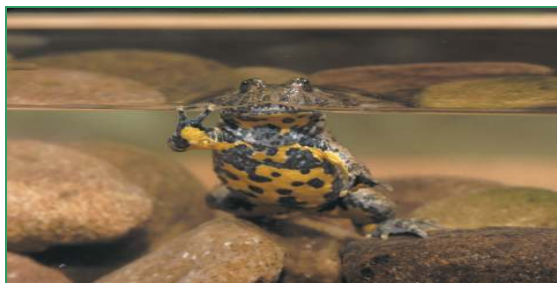
Gelbbauchunke in ihrem Element

Adolf- Höhle und die Karlshöhle sind. Die Klamm steht seit 1936 unter Naturschutz. Die „Rhätschluchten bei Burgthann „, mit den bereits seit 1910 ausgewiesenen Naturdenkmälern „Teufelsschlucht, Teufelskirche und Wolfsschlucht „, sind durch die erodierende Kraft kleinerer Nebenbäche der Schwarzach entstanden. Der außerordentliche Strukturreichtum mit vielen dicken alten Bäumen, reichlich Totholz, Felsen, Felsstürzen, Hangrutschungen, Quellen und Bächen verleiht den Schluchten neben ihrem außergewöhnlichen landschaftlichen Reiz auch große ökologische Bedeutung. Die besondere kleinklimatische Situation lässt in den kühlfeuchten Tälchen eine spezielle, sonst seltene Vegetation sprießen wie z.B. das Brunnenlebermoos, das ganze Felsen überziehen kann, und den zerbrechlichen Blasenfarne, der in den Felsspalten gedeiht. Aber auch Baumarten wie Tanne, Ahorn, Esche, Erle, Ulme und Linde, die sonst weniger verbreitet sind, finden hier ideale Wuchsbedingungen vor. Eine teils spezialisierte Tierwelt weist das Gebiet zudem als besonderen Lebensraum aus. Gelbbauchunke, Feuersalamander, Grünfrosch und Erdkröte bewohnen die naturnahen Quellschluchten, Eisvogel und Wasserramsel tauchen in den Bächen nach Nahrung, während Spechte die Bäume danach absuchen.