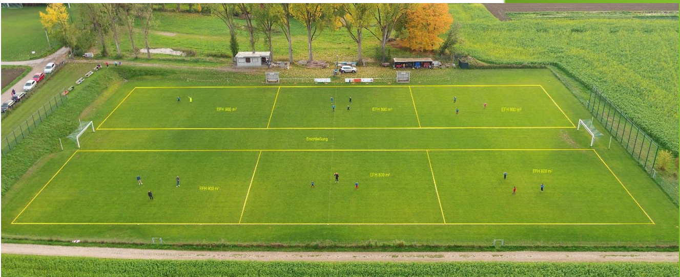
Großzügige Parzellierung mit Platz für 6 Einzelhäuser (18 Personen)

Ergebnis des Experiments: Bei einer leicht verdichteten Bauweise können auf der Hälfte der Fläche doppelt so viele Menschen wohnen. Zudem bleibt jede Menge Freiraum für Natur, Erholung oder auch zukünftige Entwicklungen.