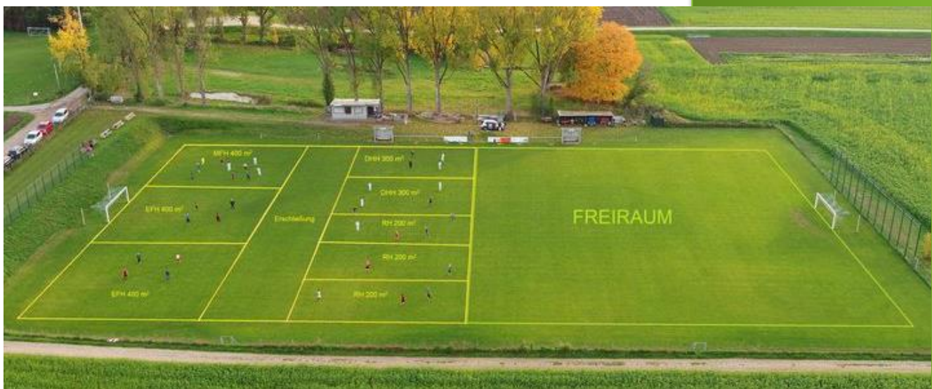
Verdichtete Mischbebauung mit Platz für 2 Einzel- und 3-Reihenhäuser, 1 Mehrfamilienhaus (36 Personen)