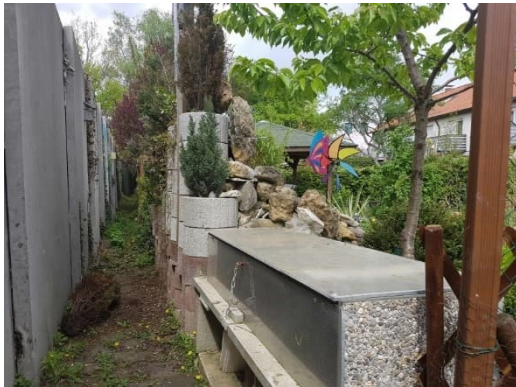
Bereich C2 (Glasschleifweg)

Die bestehenden Lärmschutzwände befinden sich in einem Abstand von ca. 1,0 m zur Flurgrenze. Daran grenzen private Gartenanlagen an.