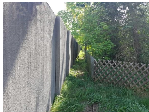
Bereich D10 (Laufamholzstraße)

In diesen Bereichen soll von einer dauerhaften Inanspruchnahme von Privatgrund abgesehen werden. Eine vorübergehende bauzeitliche Inanspruchnahme wird für den Rückbau dieser Lärmschutzanlagen erforderlich.